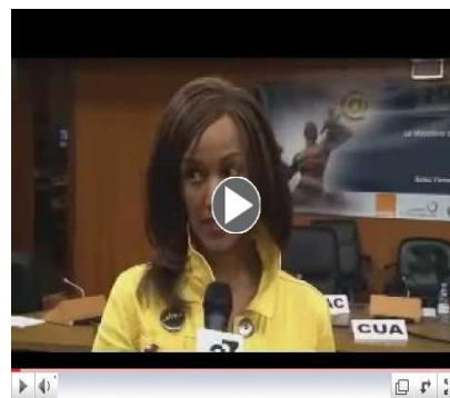
DCA Défend son Opposition à l'Agenda de la réunion des experts de la Task Force sur le DotAfrica

Avant l'ouverture de l' ICANN meeting, la DCA a assisté à la Table Ronde ministérielle africaine du 19 au 21 Octobre 2011 où la question du DotAfrica a été discuté et un communiqué demandant à l'ICANN d'ajouter les noms Dotafrika, Dotafrique, et Dotafrikia à la liste des noms réservés au bénéfice de l'Union Africaine. Durant cette réunion, nous avons insisté sur ce que nous avons toujours cru ; Notre engagement à l'ouverture, transparente, compétitive, et globalement acceptés le processus du Guidebook de l'ICANN pour les nouveaux. DCA a brillamment fait cas que les noms liés à DotAfrica n'ont aucun risque, et comme tel ne mérite aucune protection législative spéciale et pourrait être appliquée dans le cadre du