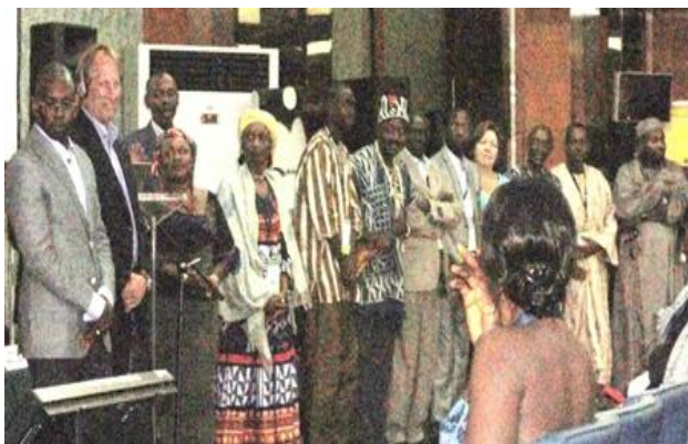
Participation africaine pour le développement de l'Internet