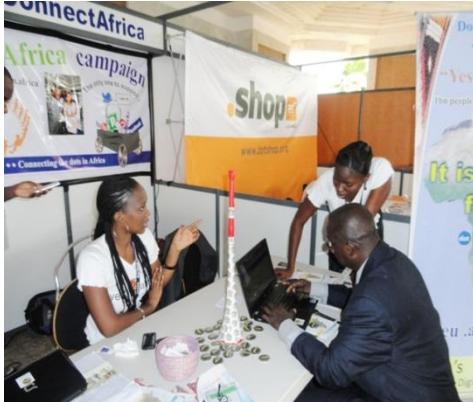
Plus de 800 visiteurs à l'exposition de la DCA

Depuis DotConnectAfrica a également été un Silver-level sponsor de la rencontre de l' ICANN de Dakar, il a également eu le privilège de monter une exposition sur DotAfrica en ligne avec notre soutien continu pour l'inclusion de l'Afrique pour les discussions liées aux questions de l'Internet. DCA a parrainé deux réunions de l'ICANN. Notre Stand d'exposition à Dakar était un arrêt populaire pour les participants intéressés par l'initiative du nouveau gTLD DotAfrica. Comme Africains, nous embrassons toujours les initiatives qui unifient notre continent et de nombreux participants qui ont visités notre stand, avaient de grands espoirs pour un nouveau gTLD panafricain. Nous avons été profondément inspirés par la démonstration d'un grand enthousiasme pour DotAfrica par tous ceux qui ont visité l'exposition DotAfrica de la DCA à Dakar.