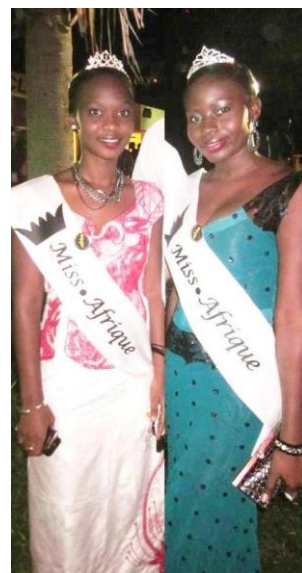
Miss DotAfrica au Diner de Gala

A Dakar, une fois de plus, nos Miss DotAfrica bénévoles ont eu la chance d'apprendre autour des domaines aussi larges que les nouveaux programmes gTLD et d'autres questions pertinentes et les délibérations politiques. DCA espère parrainer plus de jeunes filles leaders dans la future pour assister à des conférences et contribuer à façonner l'avenir de l'Internet en Afrique.