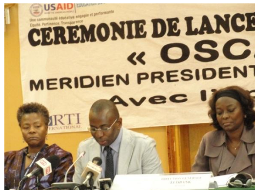
Ministre M.Gurassey lancement de OSCAR TICE

DotConnectAfrica a encore émis en avant le cas final d'une Afrique pour l'urgente nécessité d'une présence unifiée sur Internet et nous pensons que le message a été bien reçu!