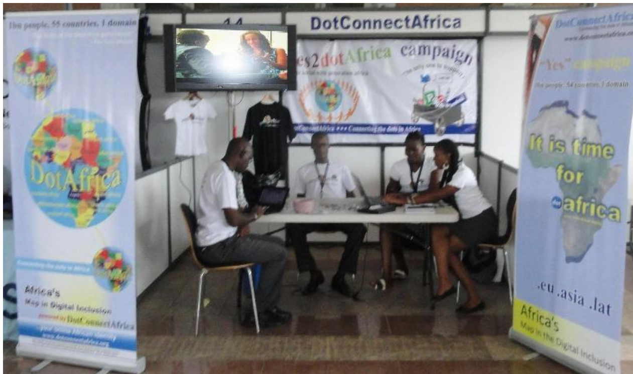
DotConnectAfrica sponsor and participant de la 42e rencontre Internationale de l' ICANN qui a eu à Dakar du 23 au 28 Octobre 2011 au Méridien Président.